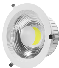
RÉFLECTEUR LED COB 20W BLANC FROID DEC/DLCOB-20W