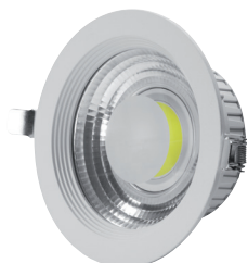
RÉFLECTEUR LED COB 20W BLANC CHAUD DEC/DLCOB-20BC