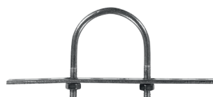
ATTACHE POUR MONTAGE MAT DEC/GL20W-PM