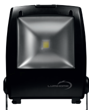
PROJECTEUR LED COB 50W BLANC FROID DEC/GL50W-PR